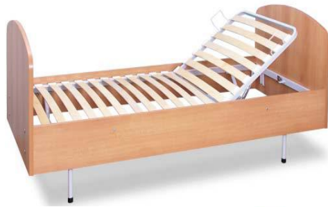
ABB-L90-0 – polohovateľné lôžko (nepojazdné)