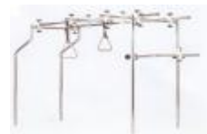
ortopedická hrazda KOV5370