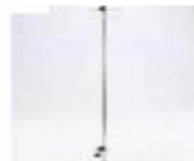
infuz. stojan KOV5650