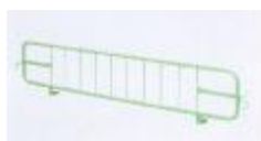
zábrana k posteli KOV5180