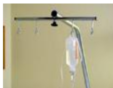
Infúzne držiaky a stojany