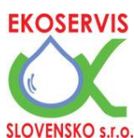
EKOSERVIS SLOVENSKO s.r.o.