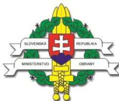
Ministerstvo obrany SR