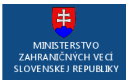
Ministerstvo zahraničných vecí SR